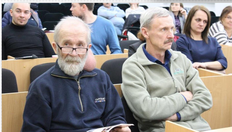
Сход граждан и ПЭК