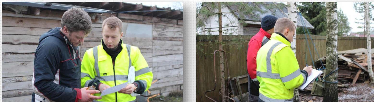
Беседы с владельцами