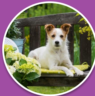
«Трубников Бор» и «Дунай»