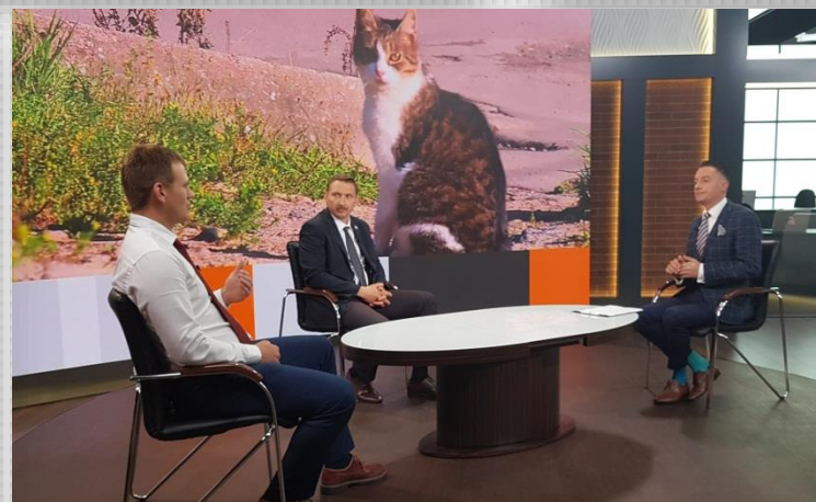
СМИ и сайт