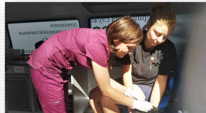
Вакцинация в СНТ